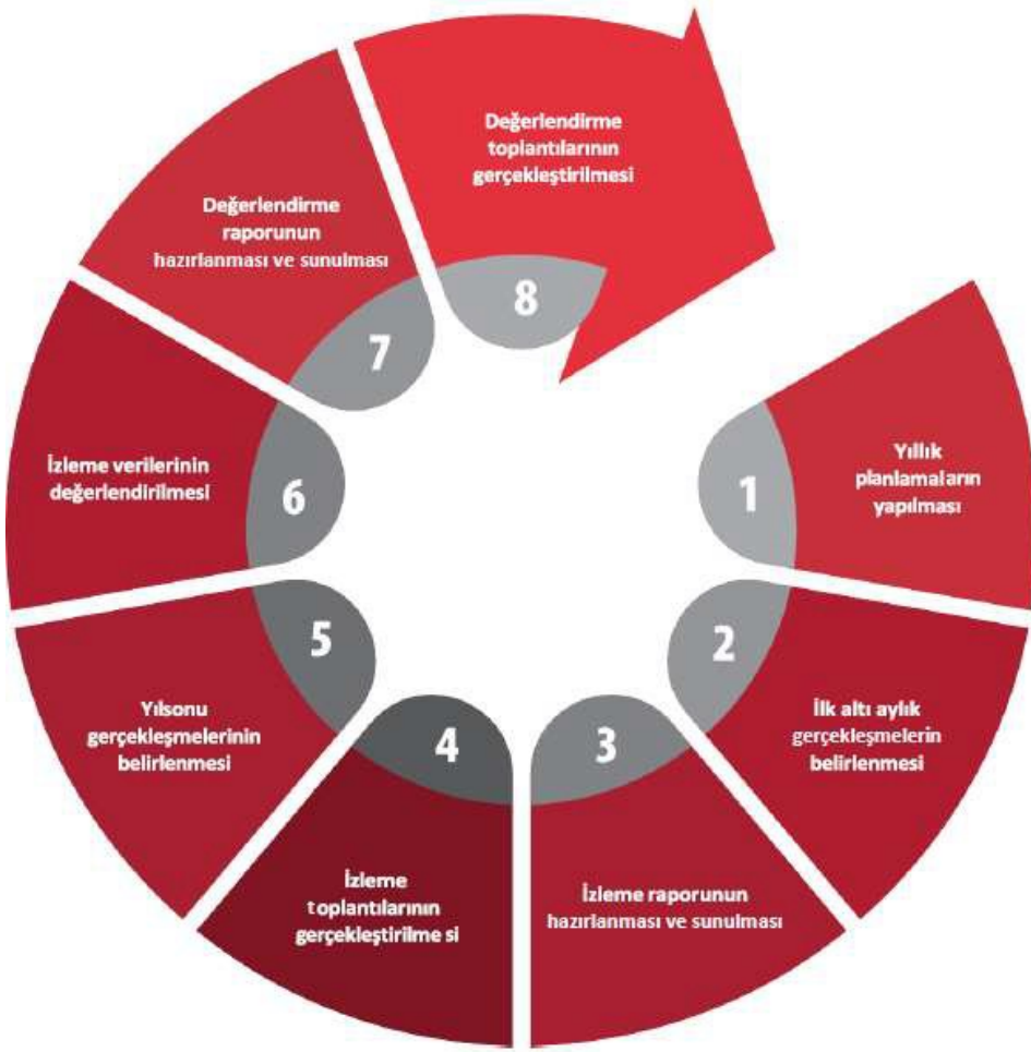
Şekil: İzleme ve Değerlendirme Süreci